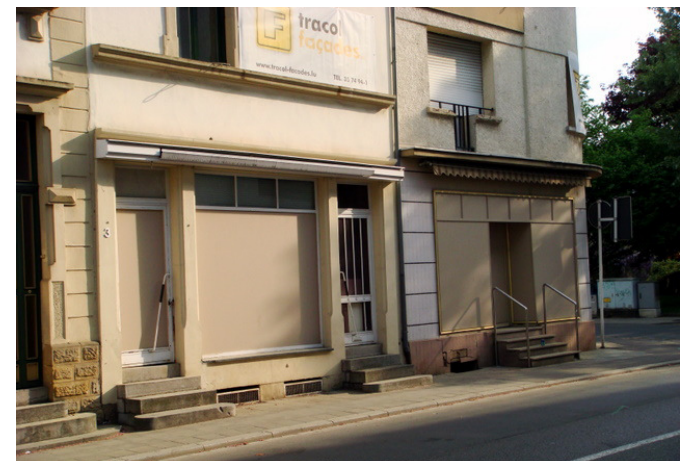
Die Zukunft für die Düdeler Geschäftswelt?

Sollte die Outlet Mall nämlich erst einmal stehen, dann ist kaum anzunehmen, dass der Einzelhandel und sein gesamtes Umfeld in Düdelingen, das in den letzten Jahren schon durch die in der Region entstandenen Einkaufszentren gelitten hat, grosse Überlebenschancen haben und somit ist die Zukunft von Düdelingen als lebendige Stadt gefährdet.