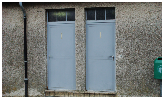
Dës Toilettë beim Kierfecht sinn net fir Behënnerter zougänglech... a maachen och soss kee gudden Androck

Fir datt dat um Terrain klappt, stinn och d'Gemengen an der Responsabilitéit.