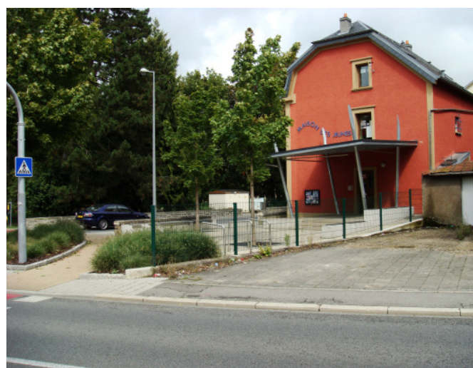
Kein optimaler Ort für ein Jugendhaus

gestalten und um neue Wege bestreiten zu können soll, falls nötig, das Personal aufgestockt werden.