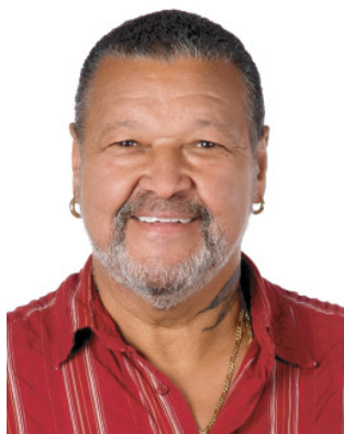
Haas Victor 65 Joer Pensionnéiert