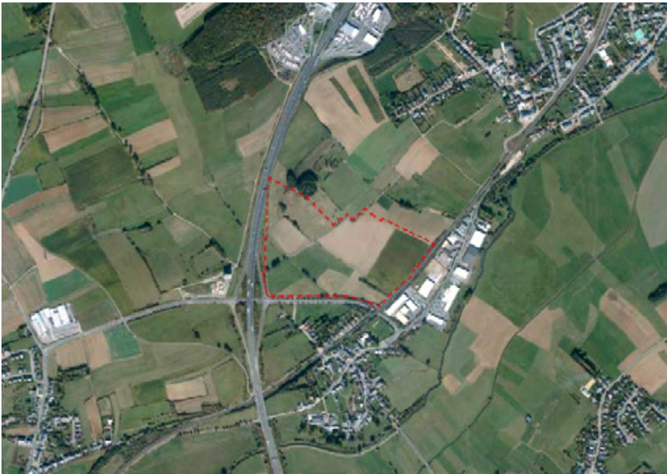
Hier soll das neue Fussballstadion und Outlet Zentrum hinkommen (rot eingegrenzter Bereich)

Vor Kurzem wurde in Livingen das Projekt des neuen Fussballstadions vorgestellt. Neben dem Stadion sind außerdem ein 75 000 Quadratmeter großes Outlet Zentrum (in der Größe der „Belle Etoile“) sowie 4500 Parkplätze vorgesehen.